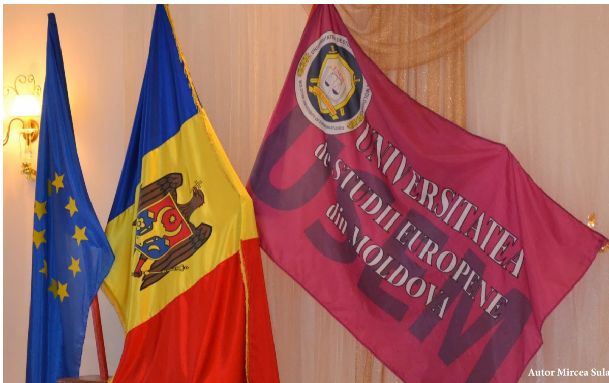
Autor Mircea Sula