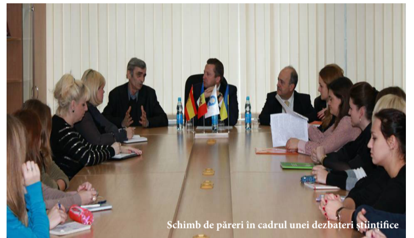
Schimb de păreri în cadrul unei dezbateri științifice

este o datorie și o trebuință pentru soț, soție și pentru copii. Soțul, pentru a-și îndeplini cu vrednicie rolul de bărbat luptător pentru bunăstarea și fericirea casei, soției, pentru a-și îndeplini cu cinste rolul de regină a căminului, de soție credincioasă și mamă bună; iar copiii pentru a învăța să deosebească lumina de întuneric, să crească în virtute și să osîndească viciul, să facă binele și să se ferească de rău.