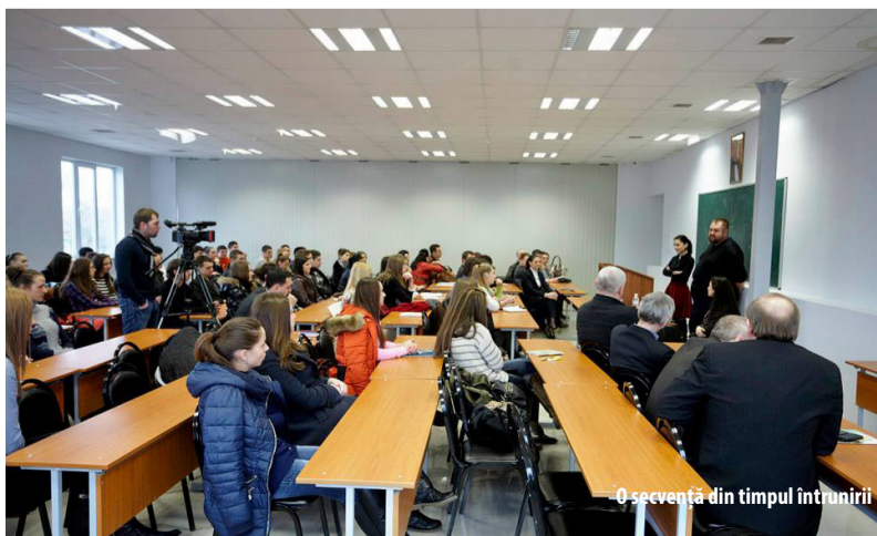
O secvență din timpul întrunirii

Selectare și redactare „Redacția «Reporter USEM»”