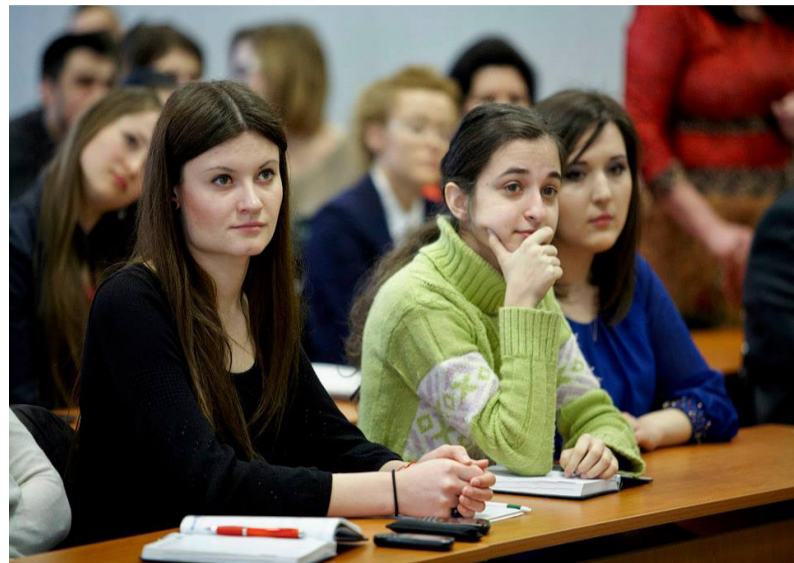
Studentii meditando asupra celor aflate

mult, pe când la dezbateri trebuie să taci mai mult și să provoci invitatul. Plusul emisiunii despre care vă vorbeam anterior a fost enorm. Eram obligat să citesc patru cărți pe lună, ceea ce îmi permite