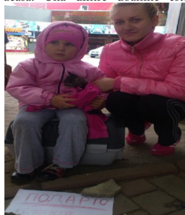
Mașa cu mama în așteptarea unui nou stăpîn pentru pisoi

La picioarele copilei, este fixată în patru pietre, o foaie pe care este scris cu litere de culoare roșie, un mesaj în limba rusă, care sună astfel "подарю" - dăruiesc. Curiozitatea și mirarea mă obligă să mă apropie pentru a afla mai multe detalii. Îndată ce-mi îndrept privirea și fac câțiva pași spre ea, două doamne, îmi zic într-un singur glas, "luați-l vă rog, uitați-vă cât e de drăgălaș!" îndemnându-mă să iau pisoișul acasă. Una dintre doamne este