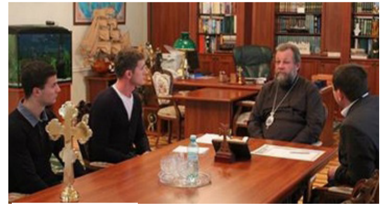
Viitorii jurnaliști în discuție cu IPS Vladimir

care au fost crescuți în spirit creștinesc. Cei mai mulți îi poți vedea în zilele Sfințului Post a Nașterii Mântuitorului, a Învierii lui Hristos, de Sfinții Apostoli Petru și Pavel sau Adormirea Maicii Domnului. Ei sunt prezenți în biserică și aceasta ne bucură pe noi fiindcă respectă legile creștinești și în același timp respectă îndemnul părinților și bunelor, care întotdeauna au fost în sfința biserică. Aș dori ca toți creștinii să frecventeze mai des sfințele biserici, căci ea îndeamnă numai la bine și dragoste față de aproapele. Acesta este mesajul