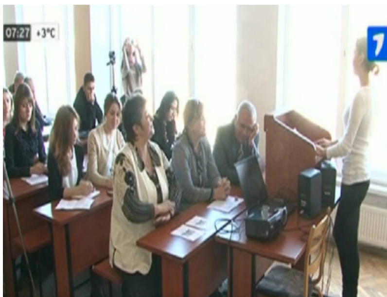
conducerea FJSC în timpul conferinței

enumerat și studenții Universității de Studii Europene din Moldova.