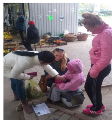
O trecătoare în discuție cu Mașa