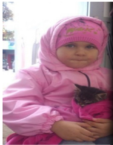
Mașa și pisoiul

Este deja ora 16:55, mulțimile de trecători par a fi impresionați de gestul fetitei, însă bunătatea lor se limitează doar la aceea că citesc