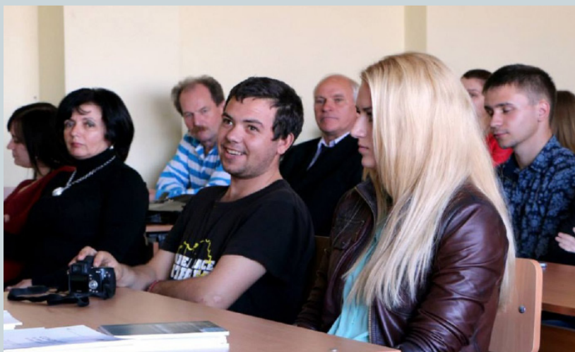
Cadrele didactice și studenții în timpul semnării acordului de colaborare